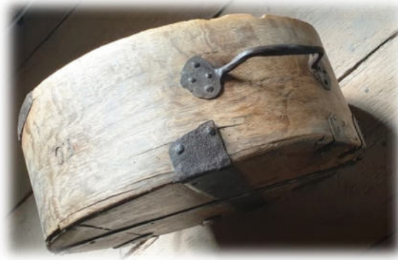
Braunschweiger Himpten –gebräuchliches Hohlraummaß