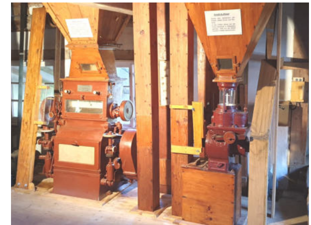
Komplett restaurierter Walzenstuhl und Grießauflöser