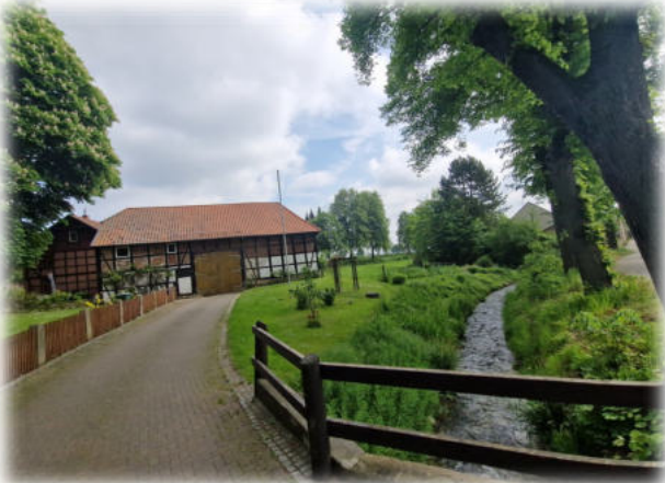
Blick auf die Wassermühle aus südlicher Richtung

Machen Sie sich bitte selbst ein Bild und kommen Sie persönlich vorbei.