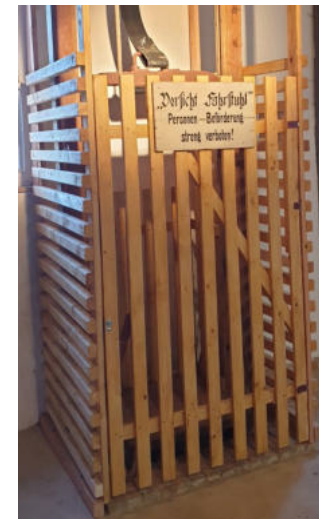
Restaurierungen im Außen- und Innenbereich